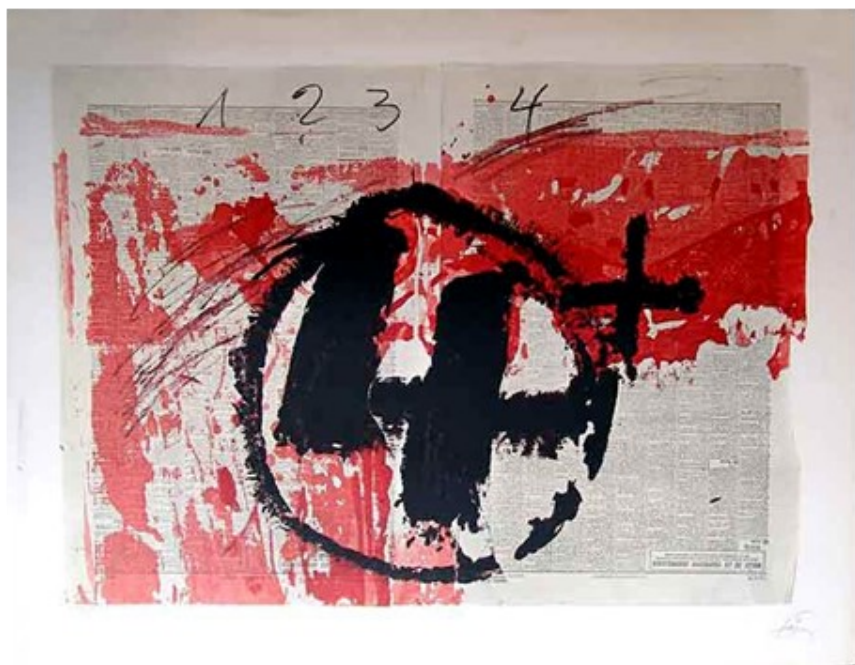
Rose amb taca negra Tàpies